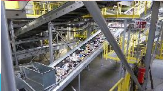
Wertstoffaufbereitungsanlage Iserlohn Lobbe GmbH