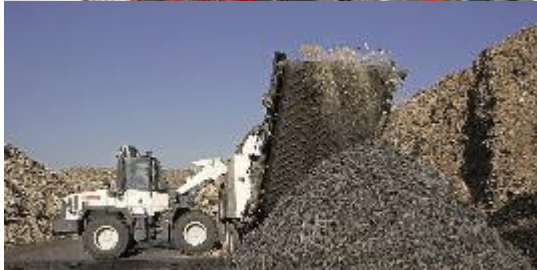
Kreislaufwirtschaftsstandort Lünen Remondis