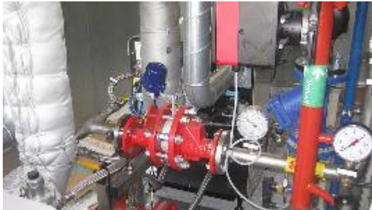
Stirlingmotor-BHKW zur Nutzung von Deponieschwachgasen Lambda Gesellschaft für Gastechnik GmbH