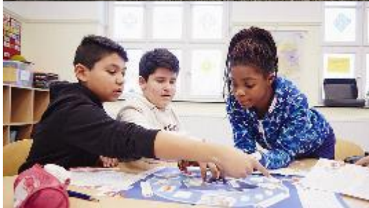
Die Wertstoffprofis Remondis